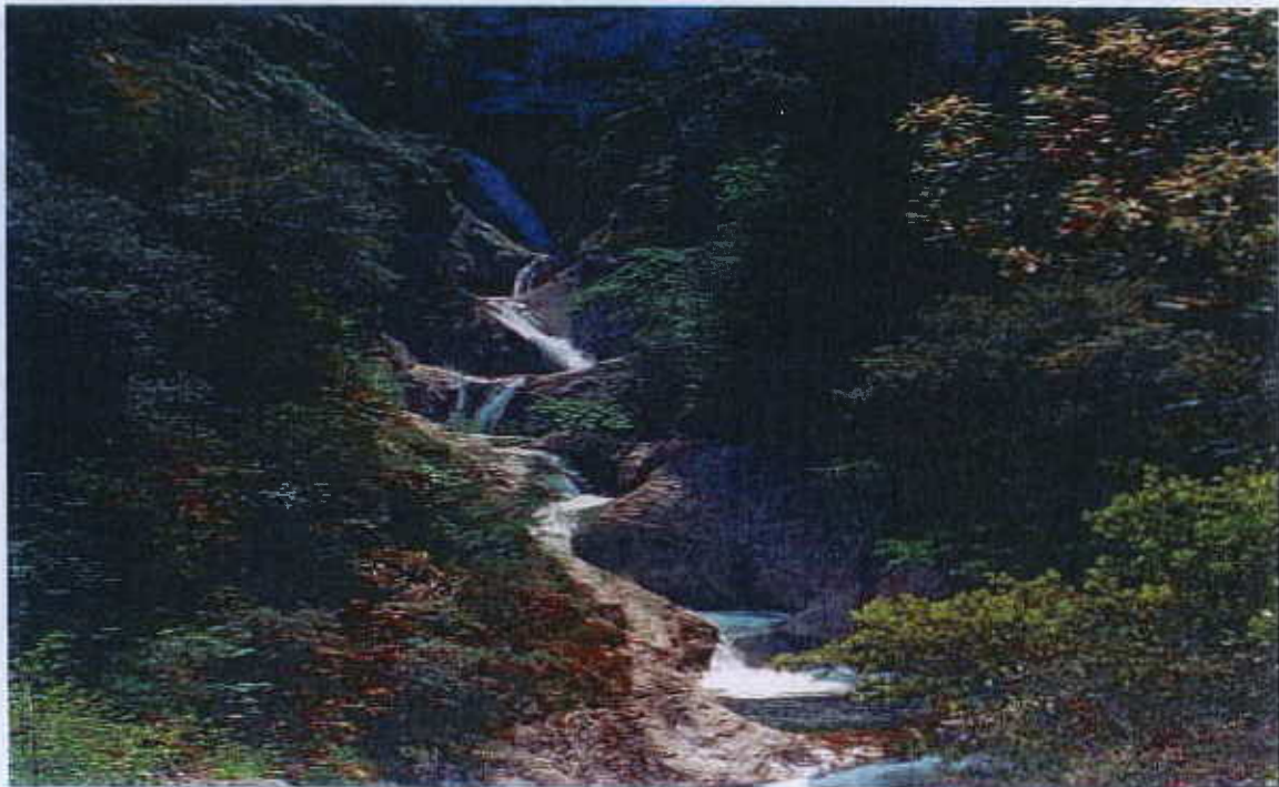
Cascades du Llech – commune d'ESTOHER