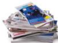
PAPIERS JOURNAUX MAGAZINES