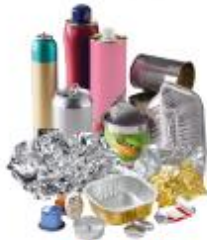
EMBALLAGES EN METAL